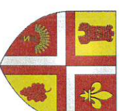
TABLEAU DES DELIBERATIONS PRISES CONSEIL MUNICIPAL du 30 mars 2023

Té debate : 04.74.30.01.42 Fax : 04.74.30.01.64 mairerevonnas@gmail.com