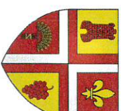
TABLEAU DES DELIBERATIONS PRISES CONSEIL MUNICIPAL du 22 juin 2023

Tél : 04.74.30.01.42 Fax : 04.74.30.01.64 mairievonnas@gmail.com