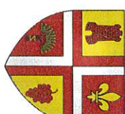
TABLEAU DES DELIBERATIONS PRISES CONSEIL MUNICIPAL du 31 août 2023