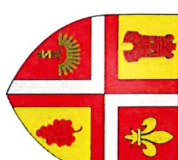
TABLEAU DES DELIBERATIONS PRISES CONSEIL MUNICIPAL du 28 septembre 2023